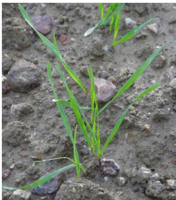
Parcelle de blé au stade « 2 feuilles »