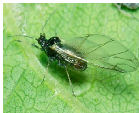
Rhopalosiphum padi ailé

Une surveillance doit être faite dans toutes les parcelles sans protection de semences insecticides.