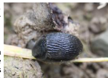
Limace noire

Deux limaces/m 2 ont été piégées sur une parcelle située à Plourin les Morlaix (29). A Ménéac (56) et à Elven (56), on a retrouvé une limace/m 2 dans les deux situations. Des dégâts sont observés sur quatre parcelles (3 blés en Ille et vilaine et 1 Orge en Morbihan) avec une moyenne de 5% de pieds touchés. Les fréquentes averses annoncées dans les prochains jours sont favorables à l'activité des limaces. Risque moyen pour les parcelles à risque élevé (cf. facteurs favorables). Risque faible pour les autres parcelles.