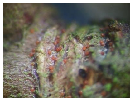
Œufs d'acarien rouge

Pour les observer, il faut une loupe de grossissement X10. Il faut dénombrer le nombre de bourgeons ayant plus de 10 œufs, en observant 100 bourgeons sur 50 arbres. Ce comptage doit se faire sur chaque variété de votre verger.