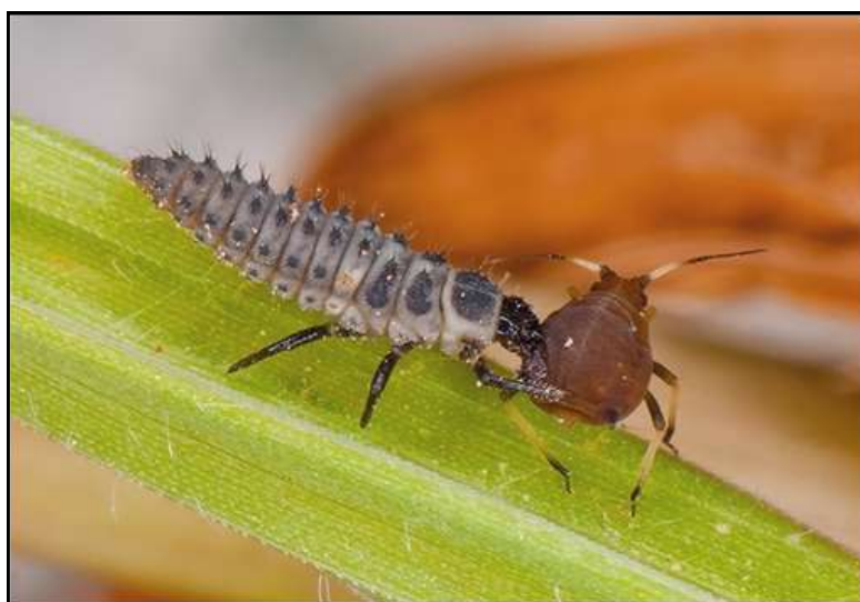
Une larve de coccinelle dévorant un puceron