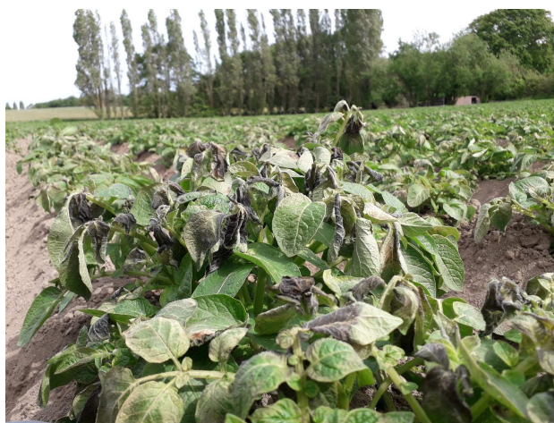
Dégâts de gel le 6 mai 2019 sur le secteur de St Méloir