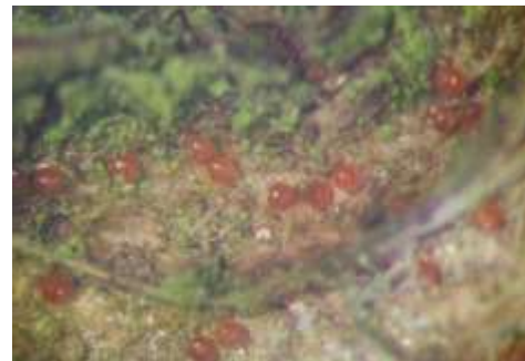
Œufs d'acarien rouge

L'acarien rouge passe l'hiver sous forme d'œufs. Ils sont de petite taille (1 mm de diamètre), ronds, de couleur rouge et pondus dans les bourrelets à la base des bourgeons.