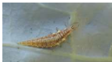
Larve de chrysope