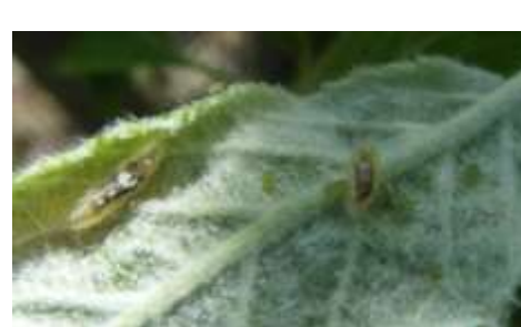
Larves de syrpe

Ce bulletin est une publication gratuite, réalisée en partenariat avec