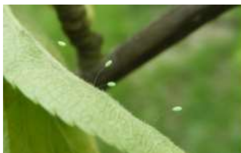
Œufs de chrysope