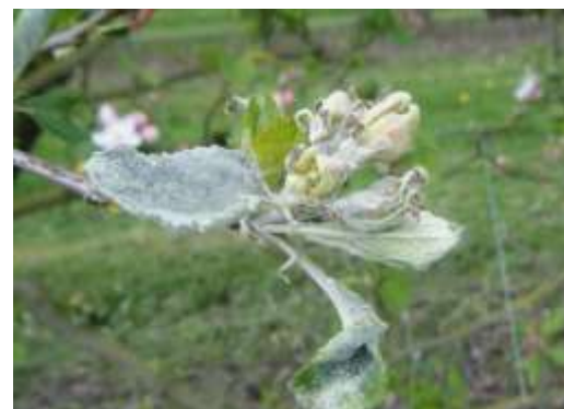
Bouquet floral oïdié

Des contaminations primaires sont possibles dès le stade C-C3 du pommier. Les jeunes feuilles sont très sensibles et la sensibilité augmente dès le stade D3-E, où les boutons s'ouvrent et deviennent plus réceptifs.