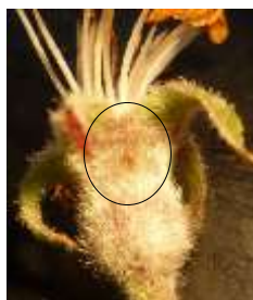
Incision de ponte

Par la suite, la larve creuse des galeries superficielles sur les très jeunes fruits, puis pénètre jusqu'aux pépins. On observe une perforation noirâtre du fruit d'où s'écoulent des déjections foncées.