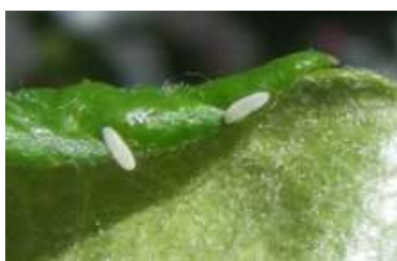
Œufs de syrpe