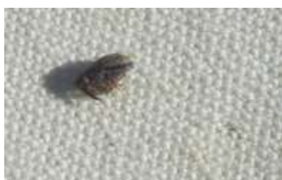
Anthome adulte immobile sur le tapis de battage