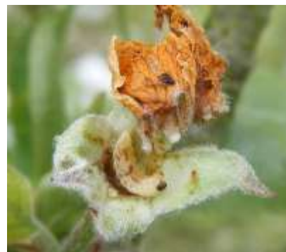
Larve d'anthome dans un « clou de girofle »