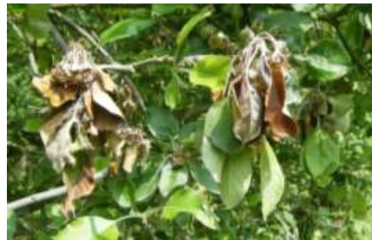
Moniliose sur fleurs

La contamination de ce champignon se fait pendant la floraison quand les conditions sont humides avec des températures assez douces.