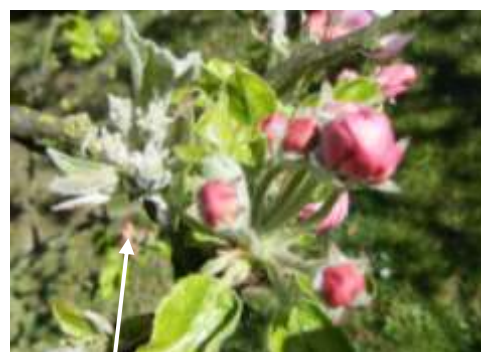
Bouquet floral oïdié

Les températures douces et une forte hygrométrie sont favorables au développement du champignon.