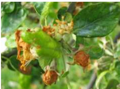
Dégâts d'anthome : « clou de girofle »

Dégâts : la fleur de pommier prend un aspect de clou de girofle. Les fleurs ne s'épanouissent pas et brunissent parce que les larves d'anthome, qui sont à l'intérieur, se nourrissent des pièces florales.