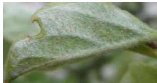
Forte population d'acariens rouges sur une feuille peu développée

Les populations devraient se diluer au fur et à mesure du développement du feuillage des arbres et diminuer avec l'action des auxiliaires.