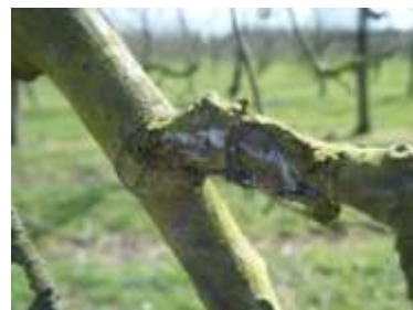
Foyer de pucerons