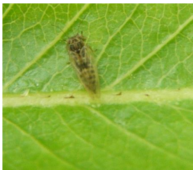
Adulte de psylle

Dans un verger de Normandie, des psylles ont été relevés. On les observe sous forme d'œufs, de larves et d'adultes.