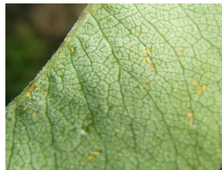
œufs de psylle