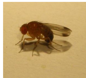
Adulte de Drosophila suzukii mâle

A suivre en fonction des conditions climatiques et de la phénologie.