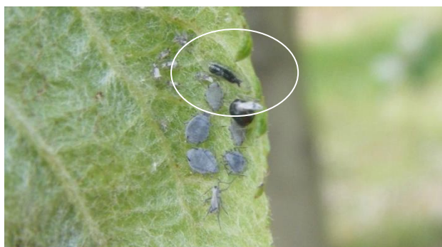
Larve de syrphe dans un foyer de pucerons cendrés

Les œufs et les larves de syrphes sont de plus en plus visibles au sein des foyers de pucerons cendrés.