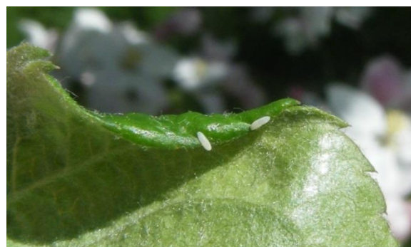
Œufs de syrphe