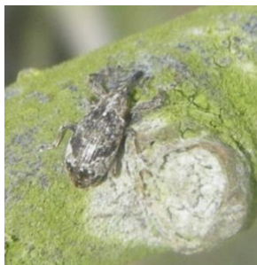
Anthomome adulte (taille : 4 à 6mm)