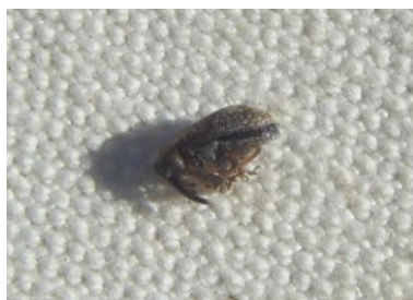
Anthomome adulte immobile sur le tapis de battage