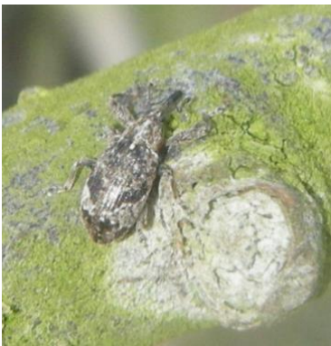
Anthome adulte (taille : 4 à 6mm)

Avant de pondre, ces charançons passent 10 à 15 jours à se nourrir. Ils pondent dans les bourgeons des pommiers qui ont atteint le stade B/C .