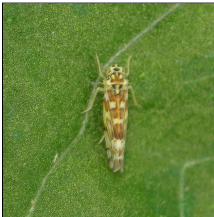
Cicadelle de la sauge (adulte)

Des foyers de cicadelles sont localisés en production sous abris sans conséquences pour les plantes. Les végétaux concernés sont: romarin, perovskia, anisodonte et phlomis.