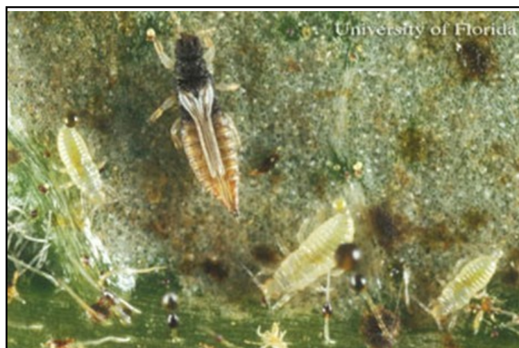
Heliothrips haemorrhoidalis , un adulte et trois larves

Deux attaques sont relevées en production sous abris sur olearia et myrte sans conséquences pour les cultures.