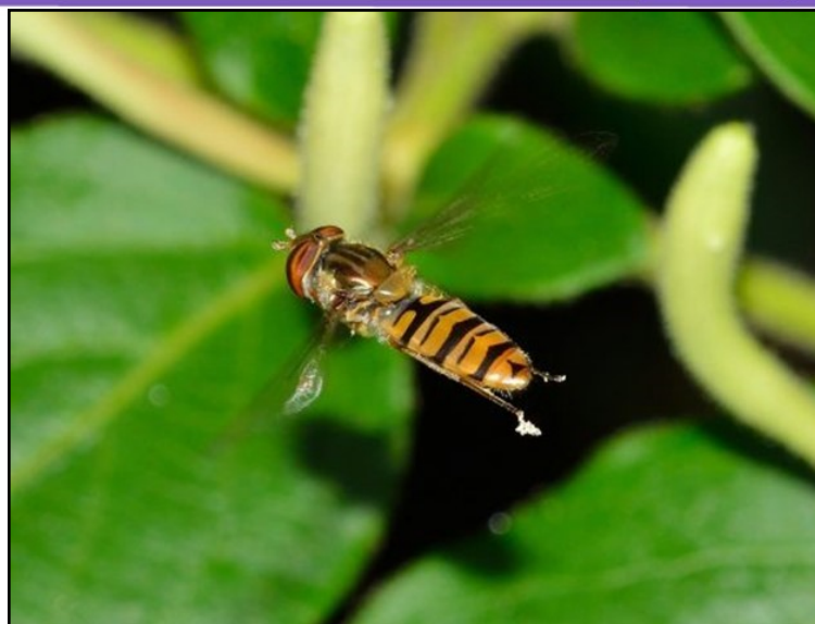
Un syrphé adulte en plein vol

Un cas de rouille à faible intensité est relevé sur seneçon sous abris dans le Finistère sans engendrer de dégâts importants.