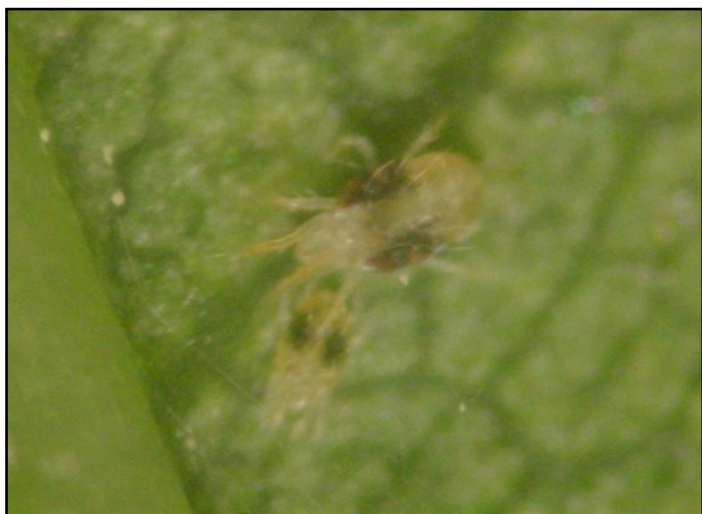
Acaris tétranyques tisserand

A noter, la présence de phytopte sur agapanthe dans une pépinière du Finistère sous abris sans conséquences pour la culture.