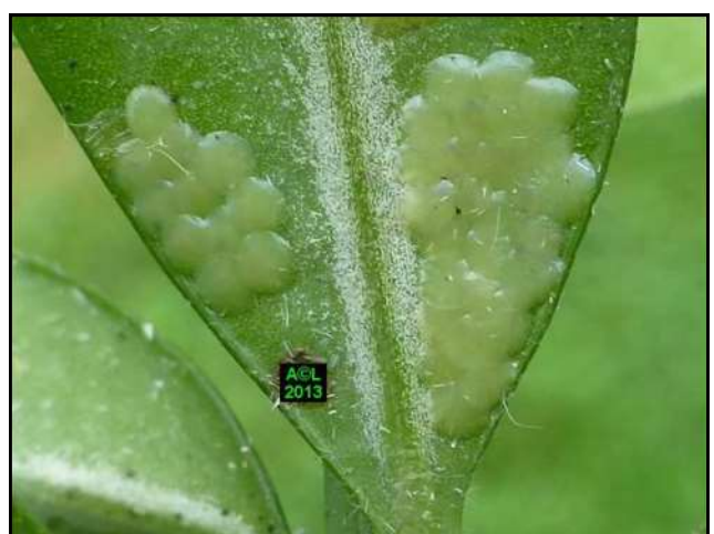
Œufs de pyrale du buis