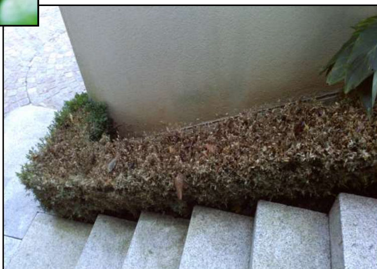
Dégâts de pyrale du buis sur buis de bordure

Retrouvez les BSV sur le site de la Chambre Régionale d'Agriculture ou le site de la DRAAF www.bulletinvegetal.synagri.com http://draf.bretagne.agriculture.gouv.fr