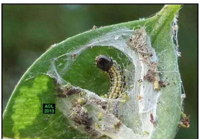
Chenille de pyrale du buis dans son logis hivernal