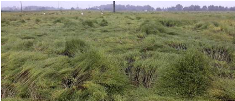
Parcelle de Breteil (35) – Forte pluviométrie entre le 2 et le 4 juin. Verse à 80% de la parcelle. Photo le 5 juin 2018.

La parcelle de Breteil (35) signale 80% de la parcelle versée (parcelle régulée – hauteur 75 cm). La parcelle du Sud 36 à Pouligny signale 5% de la parcelle versée sur la partie ayant reçu un régulateur (hauteur 75 cm), contre 75% sur la partie non régulée (hauteur 90cm).