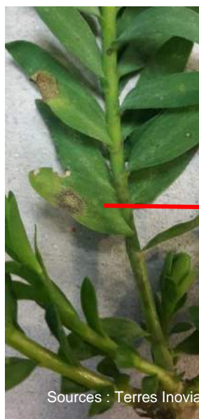
Photos : Symptômes de septoriose sur parcelle BSV en Ille et Vilaine (35) au mois de janvier 2016.

100 % des parcelles sont en dehors de la période de risque (floraison débutée) vis-à-vis de la septoriose. Le risque est pour l'instant faible. Compte tenu du contexte actuel, la surveillance doit se poursuivre. Surveillez l'apparition et l'évolution des symptômes dans les parcelles.