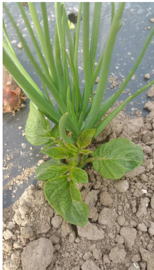
Repousse de pomme de terre sur parcelle d'échalote

La lutte peut s'opérer sur la rotation en alternant les cultures de pomme de terre avec des cultures sarclées ou désherbées avec des hormones. Dans les cultures paillées, la suppression des repousses ne peut être que manuelle, mais les inter-rangs peuvent être binés.