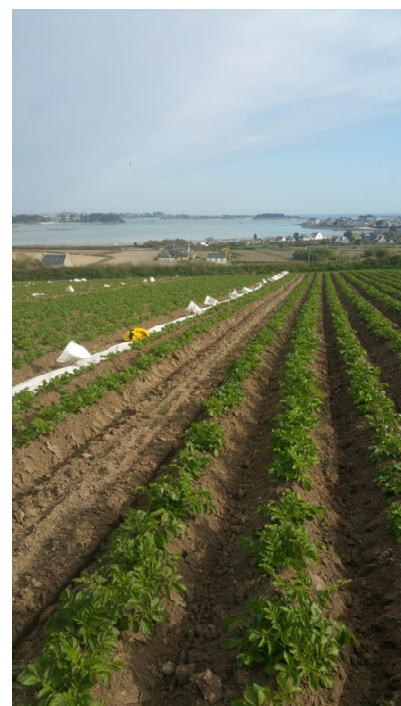
Débâchage des pommes de terre primeur

Le débâchage collectif, la protection curative réalisée et le climat sec a par la suite bloqué la maladie, mais le mildiou est toujours actif dans les tiges et peut repartir à la faveur de pluies ou de fortes rosées.