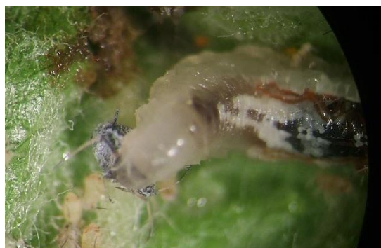
Larve de syrpe en action de prédation