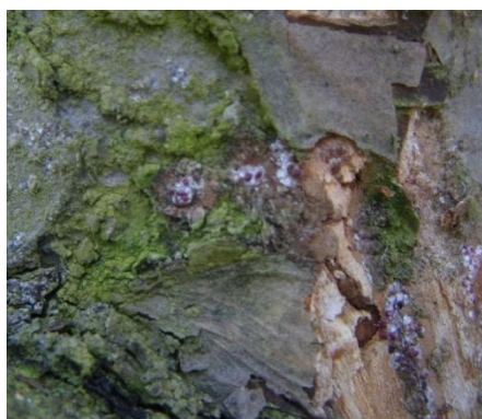
Cochenilles rouges du poirier