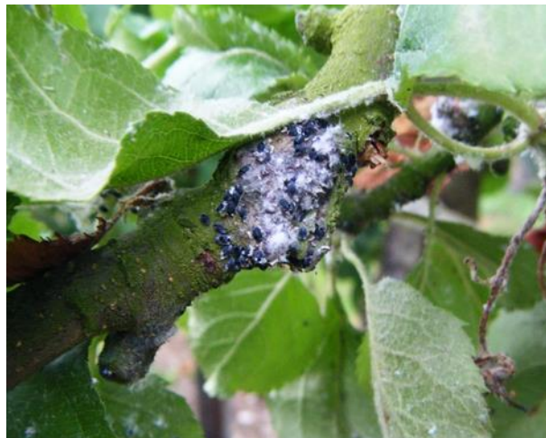
Pucerons lanigères parasités par Aphelinus mali