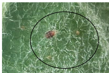
Acarien rouge et œufs d'été

Les acariens prédateurs sont en augmentation, ces auxiliaires ont un fort pouvoir de régulation des acariens rouges.