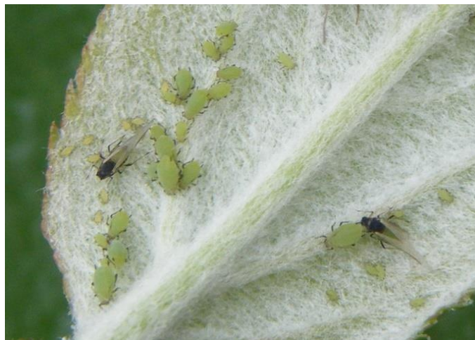
Pucerons verts non migrants