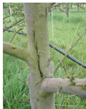
Dégât de cochenilles rouges du poirier