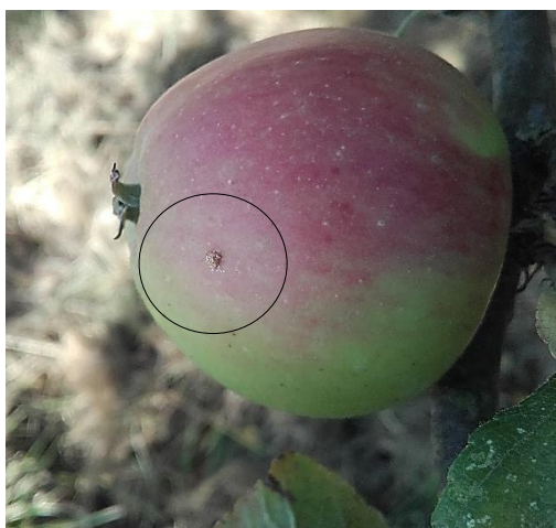
Dégâts de carpocapse

Aucune piqûre n'a été observée en Bretagne et en Normandie dans les vergers du réseau.