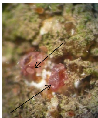
Femelle de cochenilles rouges du poirier avec œufs