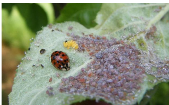
Coccinelle asiatique et ponte dans un foyer de pucerons