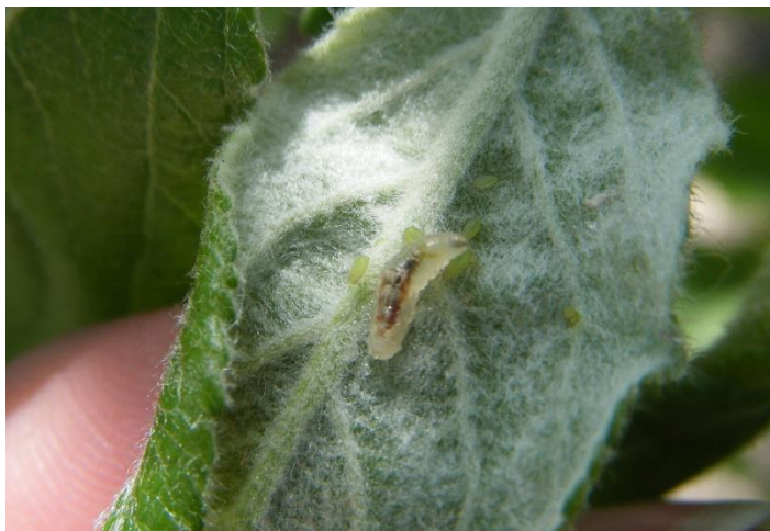
Larve de syrphes

A suivre en fonction de l'augmentation des températures et de la présence des auxiliaires.