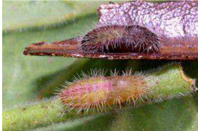
Larve et chrysalide