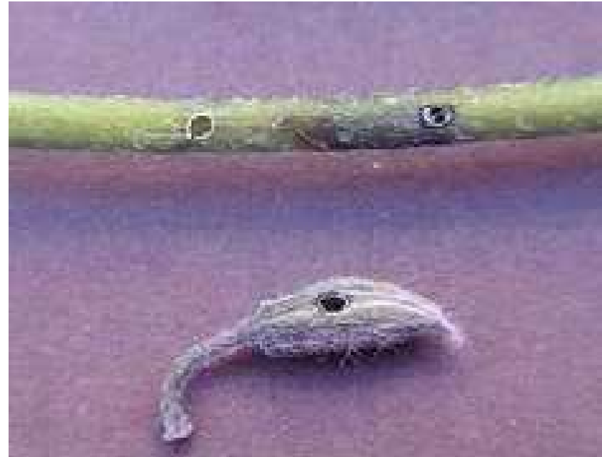
Perforation de bourgeon et de tige