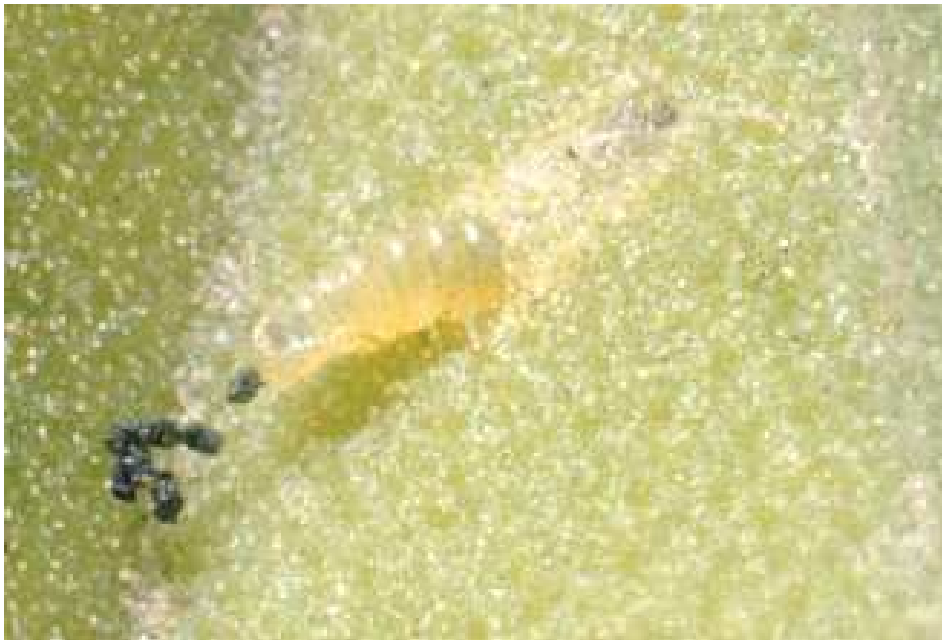
Larve pénétrant dans le tissu végétal