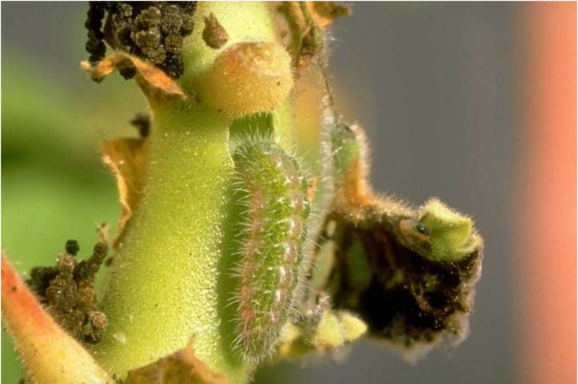
Cacyreus marshalli : dégâts larvaires