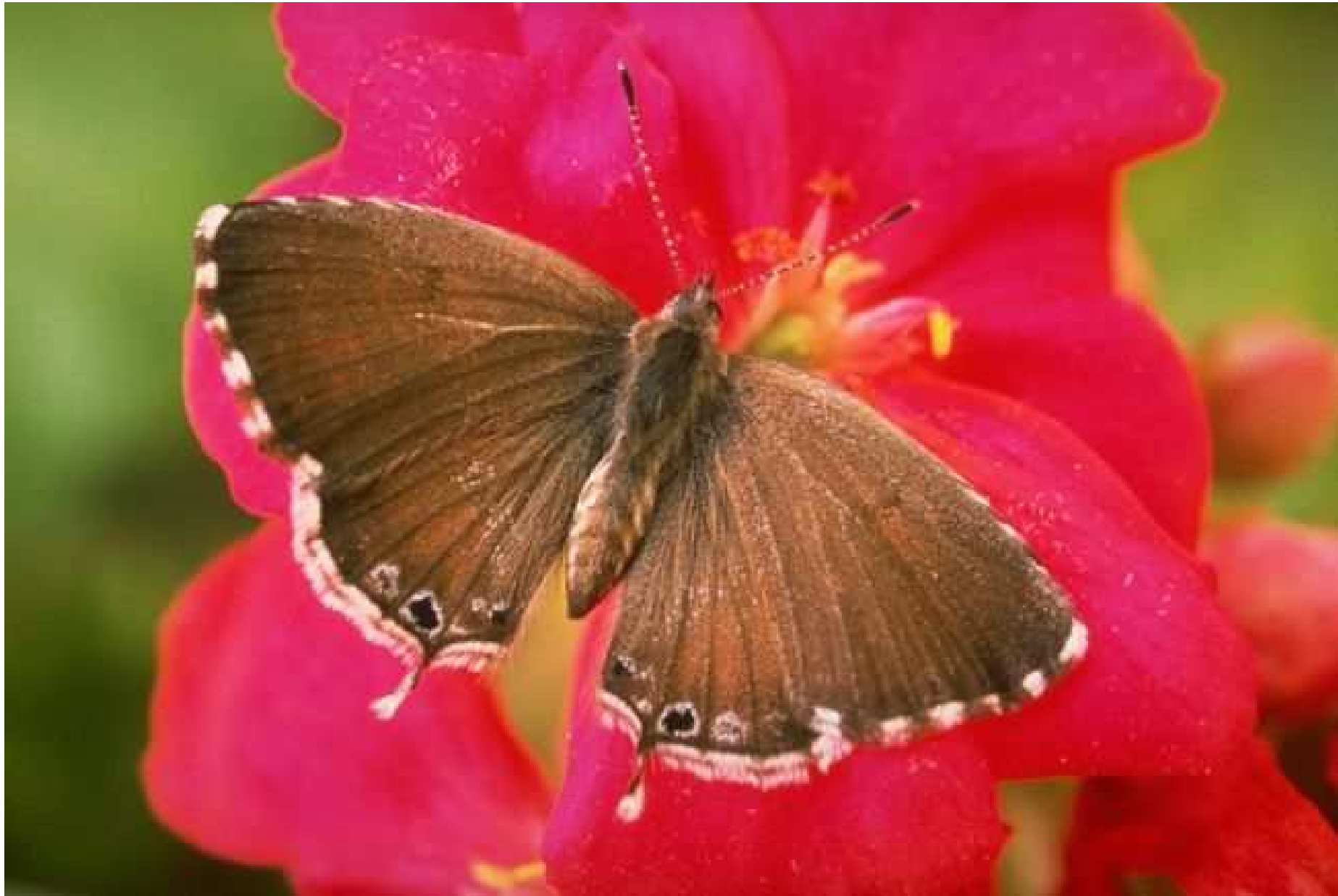
Cacyreus marshalli : papillon