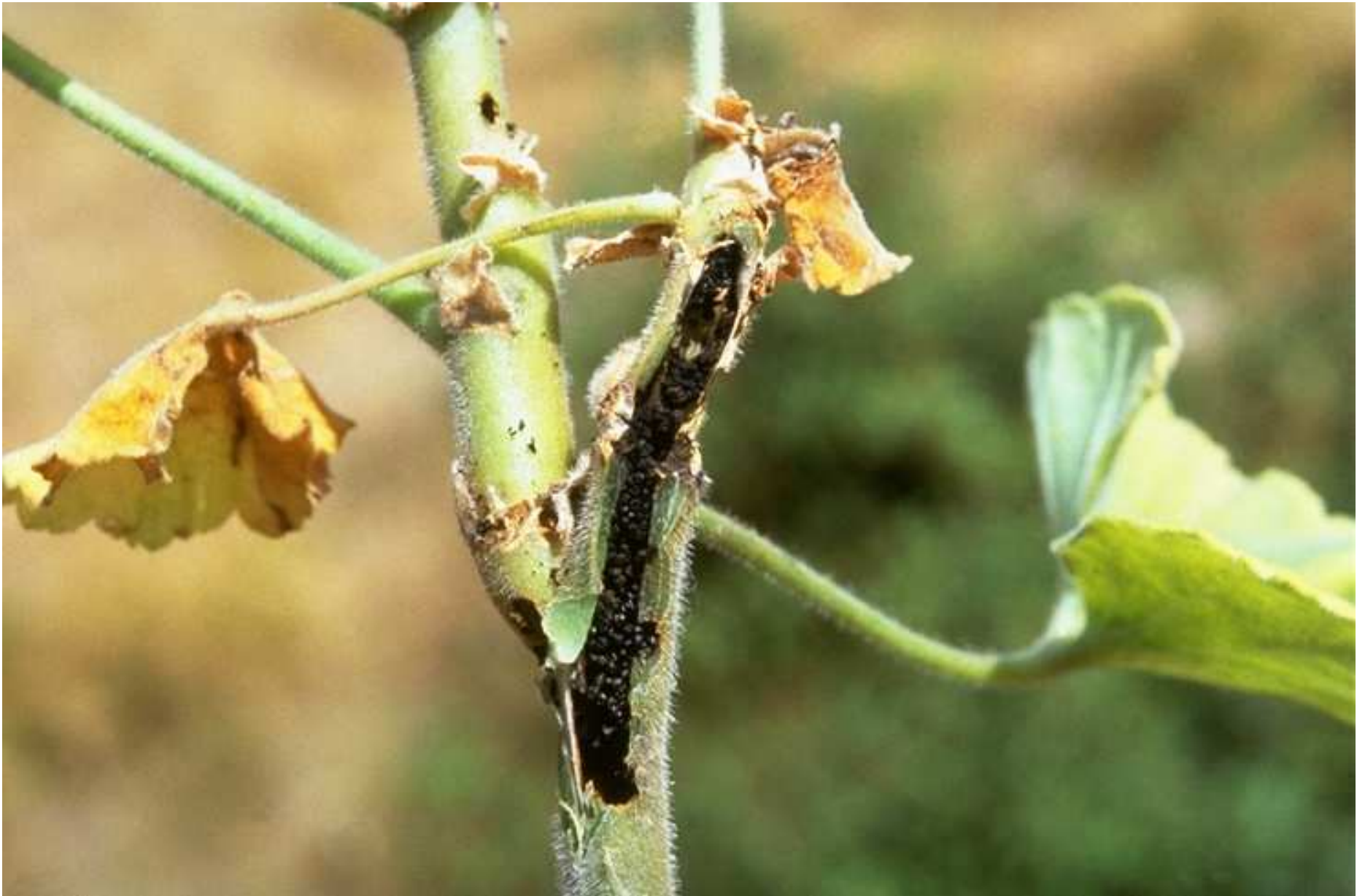
Cacyreus marshalli : dégâts larvaires