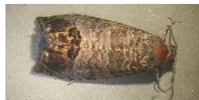
Papillon de carpocapse

Résultats des suivis des captures de carpocapse du pommier au 19/06/2024 (23/05 ; 29/05 ; 12/06 pour rappel).