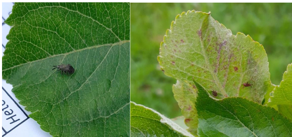
Adultes et larves de punaise Atractotomus

La faune auxiliaire est de plus en plus présente en verger : des coccinelles adultes et larves, des forficules, des larves de syrphes, des larves de chrysopes, des punaises prédatrices et des Typhlodromes.