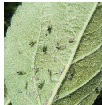
Pucerons cendrés ailés

Pour les vergers adultes (6-7 ans), suite à l'observation des premiers enroulements, réalisez une nouvelle observation la semaine suivante afin de noter la présence de la faune auxiliaire et/ou l'augmentation de la population de pucerons cendrés.