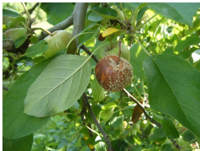
Fruit avec moniliose

En verger, les symptômes sur les fruits apparaissent à la faveur de blessures diverses (morsures de tordeuses, de forficules, de guêpes, dégâts de carpocapse, coups de bec d'oiseaux, grêle, fortes pluies...) : ce sont des pourritures fermes, brunes plus ou moins foncées, formant lorsque les conditions sont favorables (humidité) des coussinets bruns en cercles concentriques.