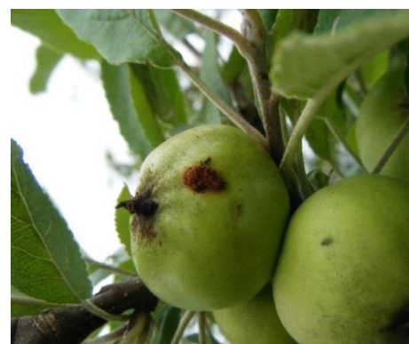
Piqûres de carpocapse plus anciennes