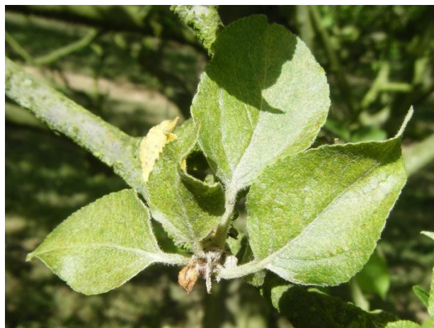
Dégâts d'acariens rouges

Des acariens prédateurs sont présents et les punaises prédatrices (notamment des genres Atractotomus sp et Heterotoma sp ) également. (Cf BSV n°13 pour la description de ces auxiliaires).