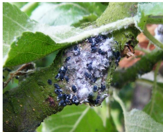
Pucerons parasités par Aphelinus mali

Le risque est faible. L'activité de parasitisme d' Aphelinus mali est efficace. Il faut le préserver et lui laisser faire son travail de parasitisme.