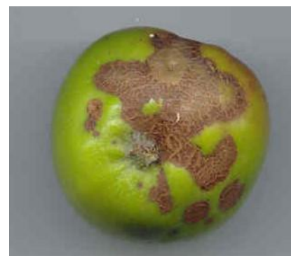
Tavelure sur fruit

https://draaf.normandie.agriculture.gouv.fr/IMG/pdf/bsv_arboriculture-fruits_transformes_bretagne-normandie-pays_de_la_loire_no01_du_22_03_2023_note_abeille.pdf