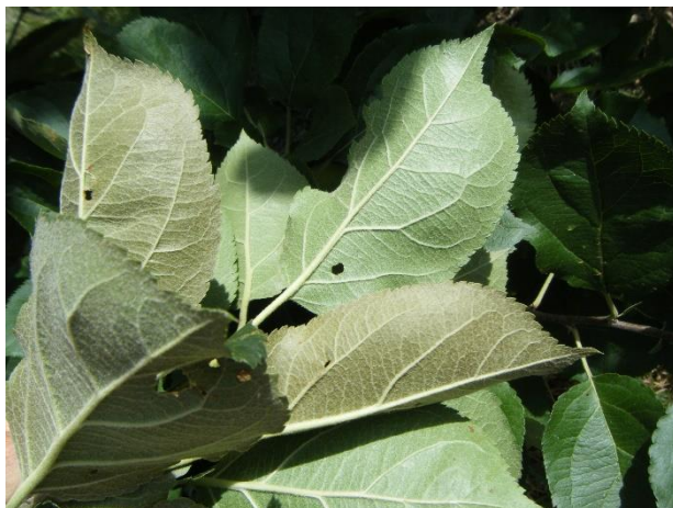
Bronzissement de la face inférieure des feuilles causé par les phytoptes

Lors de fortes attaques, on peut noter un blocage du grossissement des fruits.