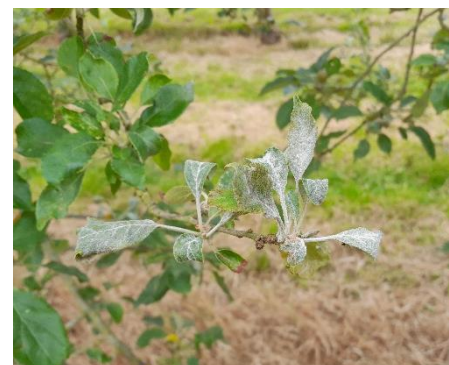
Oïdium sur Douce Moën

Une présence est observée sur des variétés plus ou moins sensibles : Douce Moën, Judeline, Petit Jaune, Judor, Dabinett, Kermerrien, Wellant et Bedan.