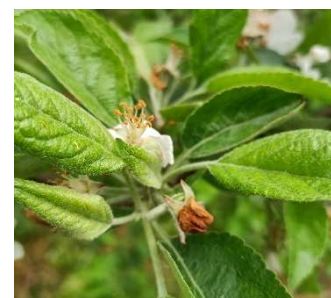
Dégâts d'anthonome : « clou de girofle »

Les dégâts sont pour le moment assez faibles.