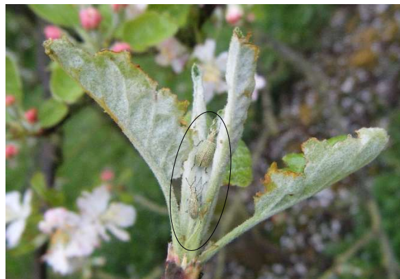
Charançons phyllophages et leurs dégâts

Attention, aux jeunes vergers ou aux vergers surgreffés, où les dégâts peuvent avoir des conséquences graves.