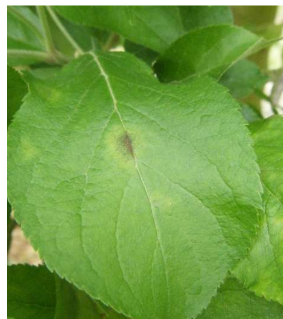
Taches de tavelure

Attention avec les stocks d'ascospores projetables accumulés depuis plusieurs jours, les risques de contaminations pourraient être importantes aux prochaines pluies (si les conditions d'humectation sont favorables).