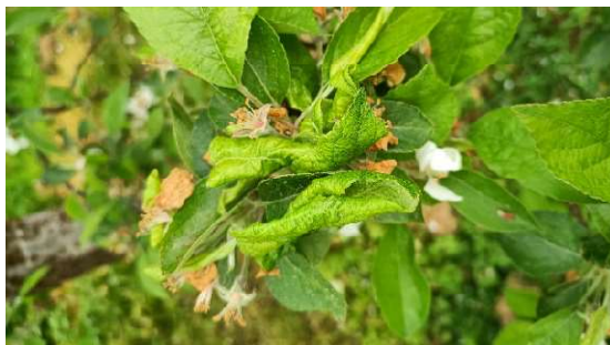
Feuilles enroulées à cause des pucerons cendrés