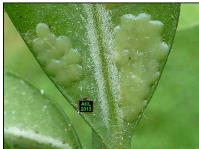
Œufs de pyrale du buis