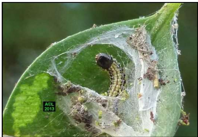
Chenille de pyrale du buis dans son logis hivernal