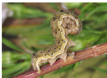
Helicoverpa Armigera Chenille à terme