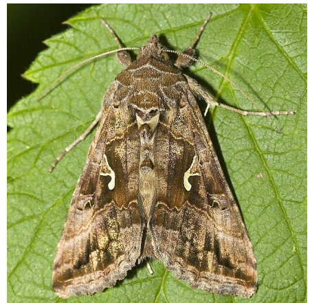
Noctuelle ( autographa gamma )