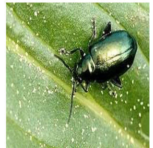
Altise ( Alticinae )

Il n'y a pas de consensus sur le seuil de risque de ce ravageur, plus l'attaque est précoce, plus l'incidence sur la culture peut être grave.