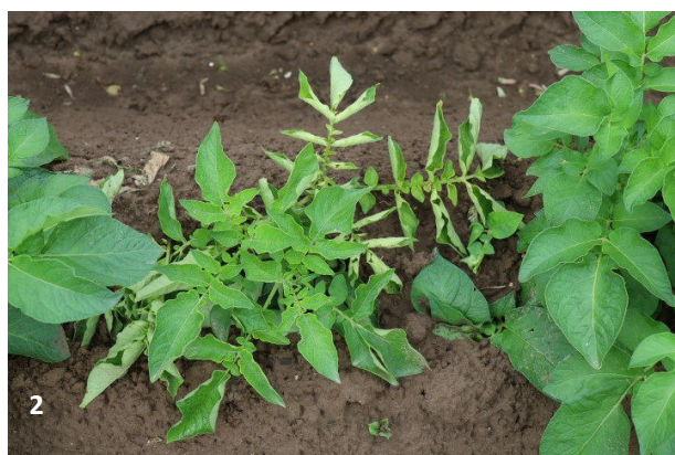
Jambe noire :