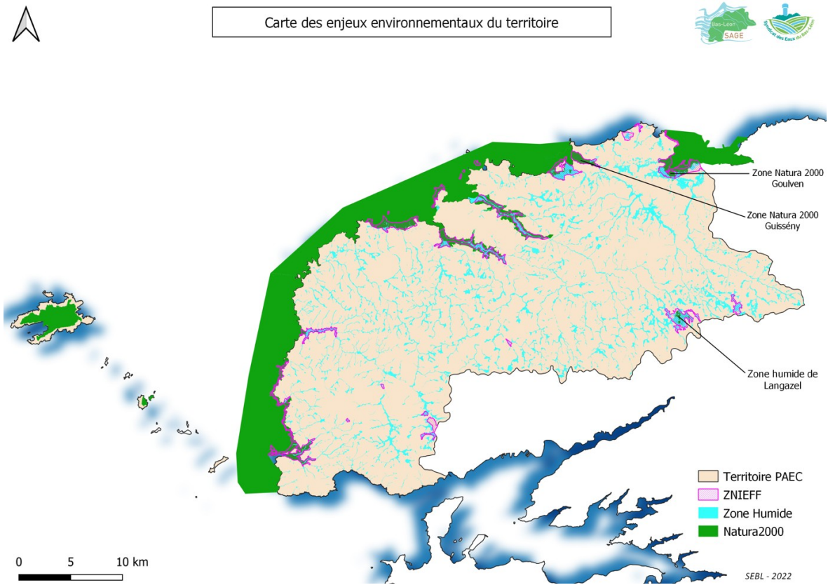
Figure 3: Carte des enjeux biodiversité du Bas Léon

Enfin, la généralisation des programmes Breizh bocage sur le territoire depuis 2015, dans le cadre de Breizh Bocage II, répond au triple objectif de la restauration de la qualité de l'eau, de l'amélioration de la biodiversité et de la valorisation économique du bois.