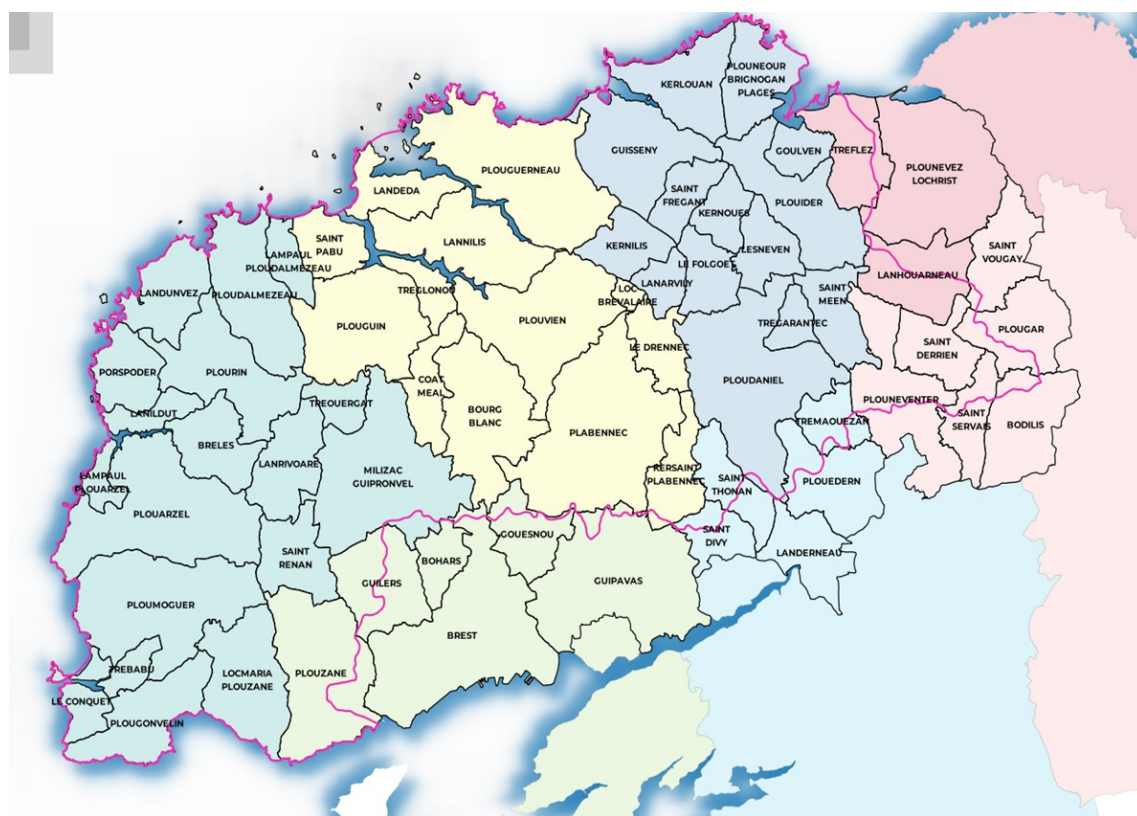
Figure 1: Carte des communes incluses partiellement ou totalement dans le périmètre du PAEC Bas Léon

En ce qui concerne les mesures « systèmes », seules les exploitations dont au moins une parcelle se situe dans le territoire la première année d'engagement sont éligibles.